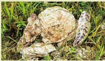
▲肥料にしている牡蠣殻